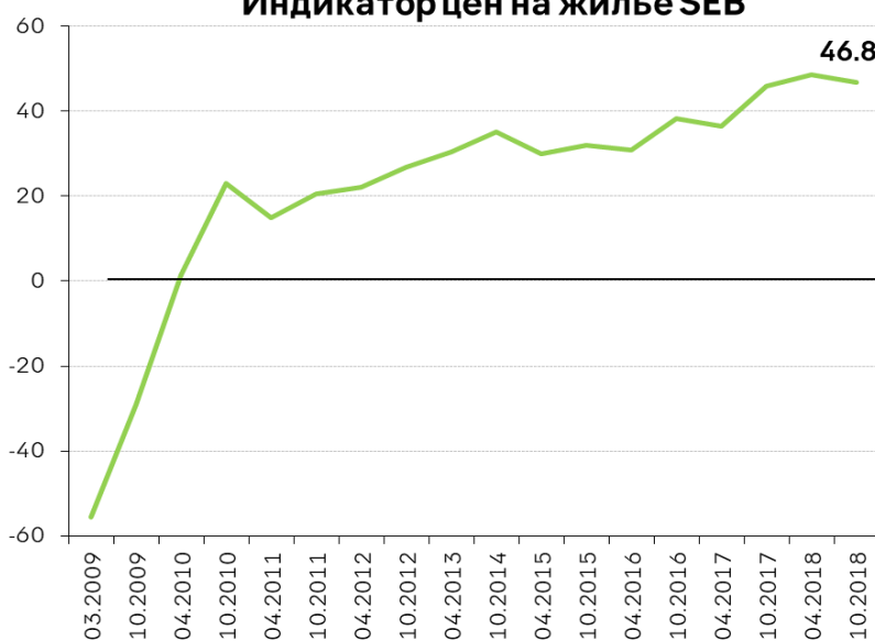
Индикатор цен на жилье SEB

© SEB banka, 2018 Данный документ является изданием информационного характера и не содержит рекомендаций. В издании использована информация из достоверных источников, однако авторы издания не отвечают за мнения, представленные данными источниками и соответствие фактов действительности. При перепечатке ссылка обязательна.